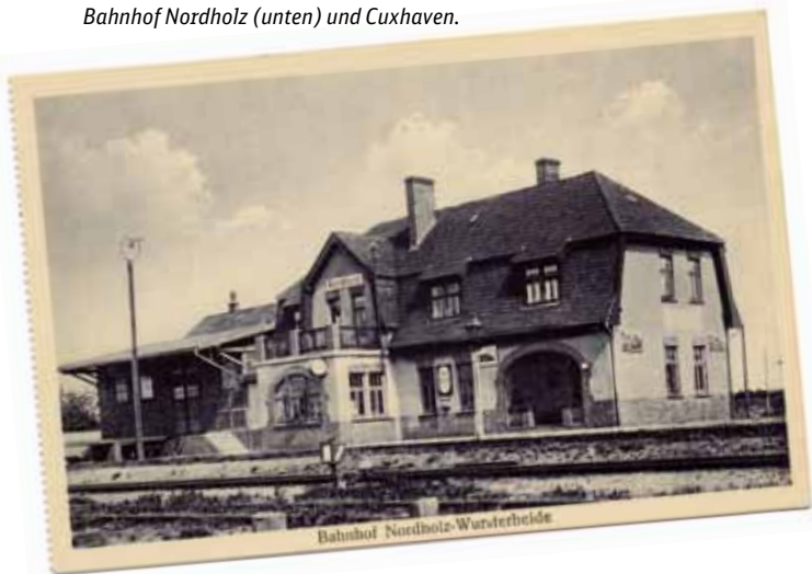
Historische Ansichten - Bahnhof Nordholz (unten) und Cuxhaven.

reisenden Publikum mit in die 4. Klasse genommen werden und wurden durch ihr Quieken zwar als unterhaltsame, aber sonst nicht angenehme Reisegesellschaft empfunden. Sie müssen sich jetzt gefallen lassen, im Packwagen befördert zu werden.“ Inwieweit militärstrategische Belange beim Bau der Bahn eine Rolle gespielt haben, ist unklar. Fest steht aber, dass die Strecke im Zuge der massiven Flottenaufrüstung im Kaiserreich eine entsprechende Bedeutung bekommt. Das zeigt sich unter anderem im Bau des Marine-Luftschiffhafens Nordholz ab 1913. Für die