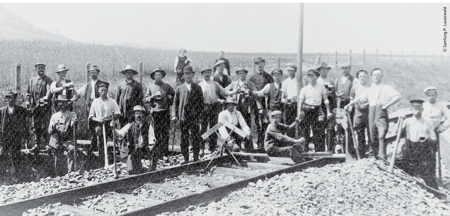
Bauarbeiten auf dem ersten Streckenabschnitt Bleicherode – Kleinbodungen 1907

Göttingen nach Rhumspringe gefahren werden konnten, wurde der Betrieb auf der Strecke zum 1.2.1982 eingestellt. Auf dem östlichen Streckenteil kam es am 28.5.1972 zur Betriebseinstellung zwischen Zwinge und Bischofferode. Nach der Wende folgten am 24.5.1998 der Abschnitt Bischofferode – Großbodungen und schließlich am 27.6.2001 das Reststreckenstück Großbodungen – Bleicherode Ost.